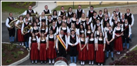
Musikverein TK Molzbichl