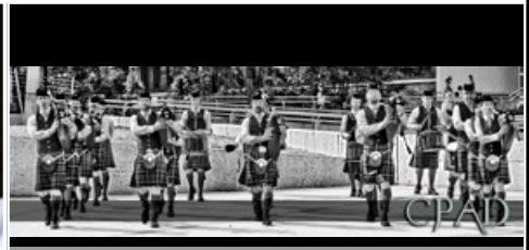
Carinthian Pipes and Drums