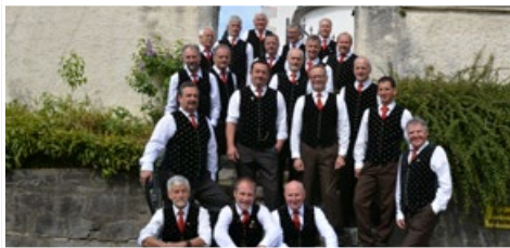
MGV Liederquell Molzbichl