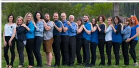
Stimmen aus Amlach