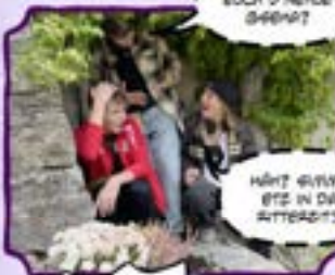
HÄHT WUVA ETZ IN DA BITTERBIT?