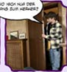
WO HICH NUR DER ISANS ZUM HERBERZ?