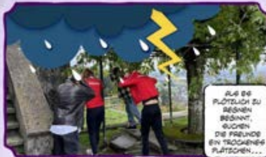
ALS ES PLÖTZLICH ZU REGNEN BEGINNT, SUCHE DIE FREUNDE EIN TROCKENES PLÄTZCHEN...