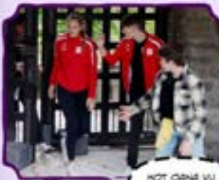
HUT OWA VU SUCHE D'NEHLE BEFRAT?