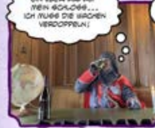
Ein Überfall auf mein Schloss... Ich muss die Wachen verdoppeln!