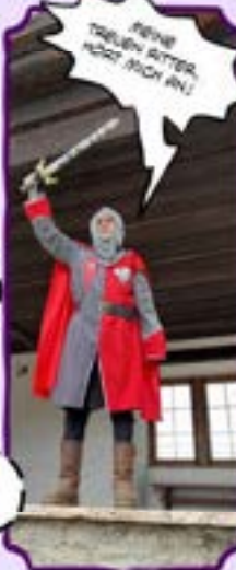
REINE TÄUDELN BITTER, HÖRT SICH AN!