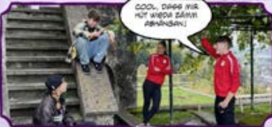
COOL, DASS IHR HUT WIEDE ZÄMMI #HANSAN!