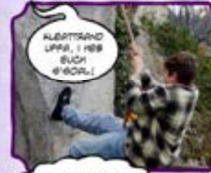
ALBERTRAND UFFA, I HEB SUCHE #WOLLE!