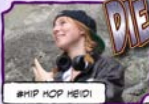
#HIP HOP HEIDI