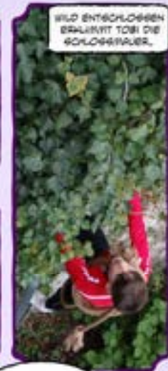
WILD ENTSCLOSSEN ERKLÄRT TOBI DIE SCHLOSSFRÄUER.