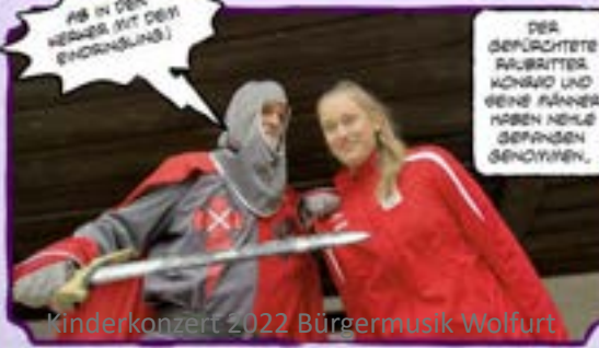
IB IN DEN HERBER, MIT DEIN (BROCKUNG!)