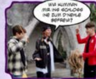
WA KUMMEN IHR INS SCHLOSS NE ZUM D'NEHLE BEFREIEN?