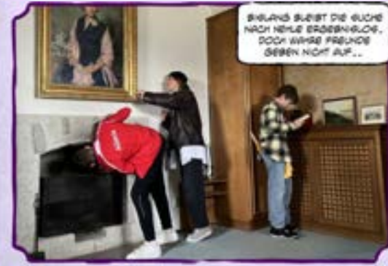
ISANS BLEIBT DIE SUCHE NACH NEHLE ERGEBENLOS, DOCH WAHRE FREUNDE SEHEN NICHT AUF...